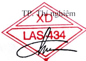
Đỗ Quốc Toàn

CÔNG TY TNHH TƯ VẤN XÂY DỰNG NÔNG NGHIỆP