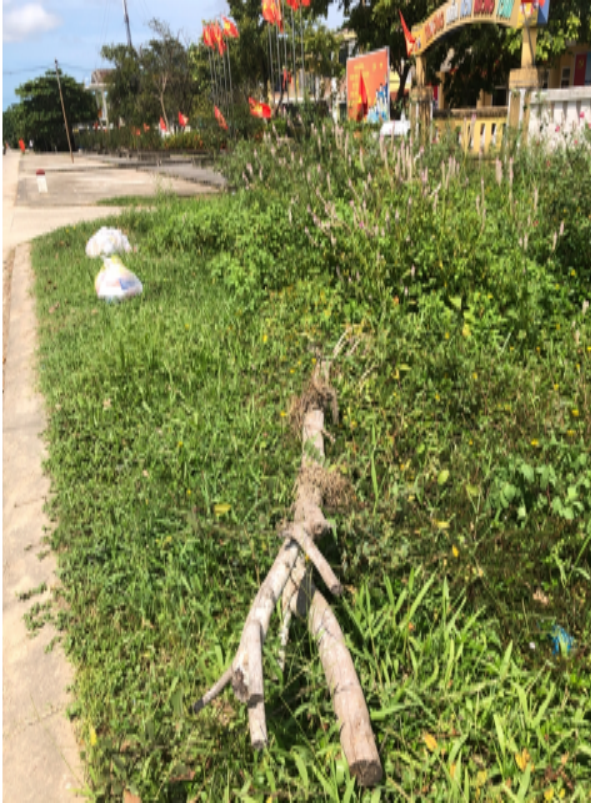
(Ảnh tại thời điểm phản ánh)